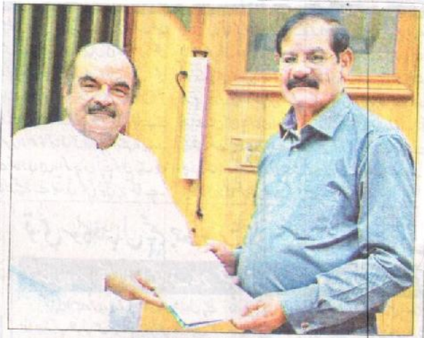
سپیکر خیبر پختونخوا اسمبلی مشتاق احمد غنی کو چیف جسٹس آئی جی عسکرت حنیف اور کوٹی سالانہ رپورٹ پیش کر رہے ہیں

ہٹانے کیلئے بہترین کردار ادا کرے گا۔ وسل بلور کے قانون پر یقینی عملدرآمد کیلئے جلد ہی کمیشن کا قیام عمل میں لایا جائے گا۔ انہوں نے ان خیالات کا اظہار چیف جسٹس راجہ نوٹیفکیشن عسکرت حنیف کو روٹی سے بات چیت کرتے ہوئے کیا جنہوں نے سپیکر سے صوبائی اسمبلی میں ملاقات کی۔ اس موقع پر چیف جسٹس نے سپیکر مشتاق احمد غنی کو روٹی آئی کمیشن کی سالانہ رپورٹ پیش کی۔ سپیکر نے مذکورہ حکم کی کارکردگی کو سراہا۔ انہوں نے کہا کہ خیبر پختونخوا اس حوالے سے ایک انفرادی اہمیت کا حامل صوبہ ہے کہ یہاں پر پاکستان تحریک انصاف کی حکومت نے زبردست قانون سازی کی۔ جو کہ دیگر صوبوں کیلئے مثالی حیثیت رکھتی ہے۔ سپیکر نے کہا کہ وسل بلور قانون ایک خاص اہمیت رکھتا ہے جس کے باعث سرکاری اداروں کی کارکردگی میں بہتری کے آثار پیدا ہونے کے ساتھ مزید نکھار آئے گا۔ انہوں نے چیف جسٹس کو یقین دہانی کروانے سے کہا کہ وسل بلور قانون پر مکمل طور پر عملدرآمد کو یقینی بنانے کیلئے وسل بلور کمیشن کے قیام کے ضمن میں وزیر اعلیٰ خیبر پختونخوا سے رابطہ کریں گے تاکہ جلد از جلد کمیشن قائم کر کے اس قانون کو موثر انداز سے لاگو کیا جاسکے۔